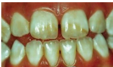
Figura 6 – Fluorose Moderado