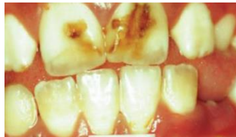
Figura 7 - Fluorose Severo