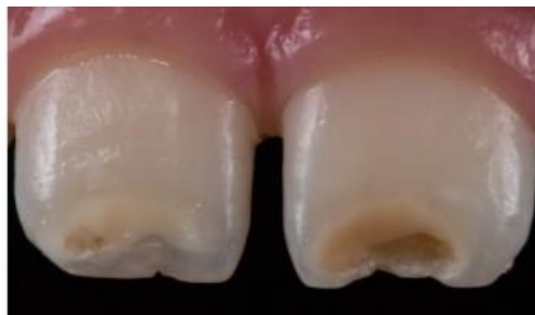
Figura 3 - Lesões hipoplásicas nos incisivos centrais superiores 11 e 12.

A hipoplasia de esmalte está associada a uma menor espessura do esmalte na área afetada, onde o tecido duro apresenta fossas profundas, sulcos horizontais ou verticais, bem como áreas com ausência parcial ou total de esmalte ou no desenvolvimento de uma linha horizontal circundando a coroa, como está demonstrado na figura 3. A formação de áreas de esmalte irregular e imperfeito ocorre pela interrupção prolongada da atividade ameloblástica (CHAGAS, JÁCOMO e CAMPOS, 2007; CORRÊA NETTO e REIS, 2011).