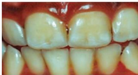
Figura 5 - Fluorose leve