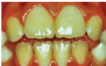
Figura 4 – Fluorose Muito Leve

pequenos traços esbranquiçados até manchas ocasionais; Muito leve (2): áreas pequenas e opacas de cor branca, porosas dispersas irregularmente sobre o dente, mas envolvendo menos de 25% da superfície dentária vestibular; Leve (3): a opacidade branca do esmalte é mais extensa do que para o código 2, mas recobre menos de 50% da superfície dentária; Moderado (4): o dente se apresenta com manchas marrons alterando sua anatomia e com uma superfície desgastada bem acentuada; Severo (5): a superfície do esmalte está muito afetada, e a hipoplasia é tão acentuada que o formato geral do dente pode ser afetado. Existem áreas com desgastes, e as manchas marrons estão espalhadas por toda parte; os dentes frequentemente apresentam uma aparência de corrosão, conforme representado nas figuras de 4 a 7 (QUEIROGA et. al. 2017).