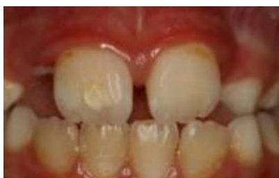
Figura 8 - Opacidades presentes em primeiros molares.

Clinicamente, o esmalte apresenta-se macio e poroso favorecendo a sensibilidade dentária e lesões cáries (Figura 8). As opacidades são delimitadas por bordas com cores que vão desde o branco ao marrom, diferenciando-se do esmalte normal, atingindo principalmente os dois terços oclusais da coroa, tanto nos molares quanto nos incisivos (FERNANDES, MESQUITA e VINHAS, 2012).