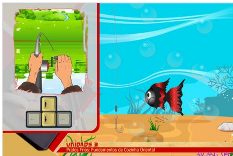
Figura 3 – Exemplo resultado final do proposto pelo DI

O pedagogo e a pedagoga são escolhidos para atuar nessa área, uma vez que eles estão preparados, ou seja, capacitados para mediar esse conhecimento, servindo como “ponte” entre o conhecimento e o educando. Eles se mostram participativos, ativos no desenvolvimento das atividades educativas. Assim, os educadores são desafiados a construir uma prática emancipadora.