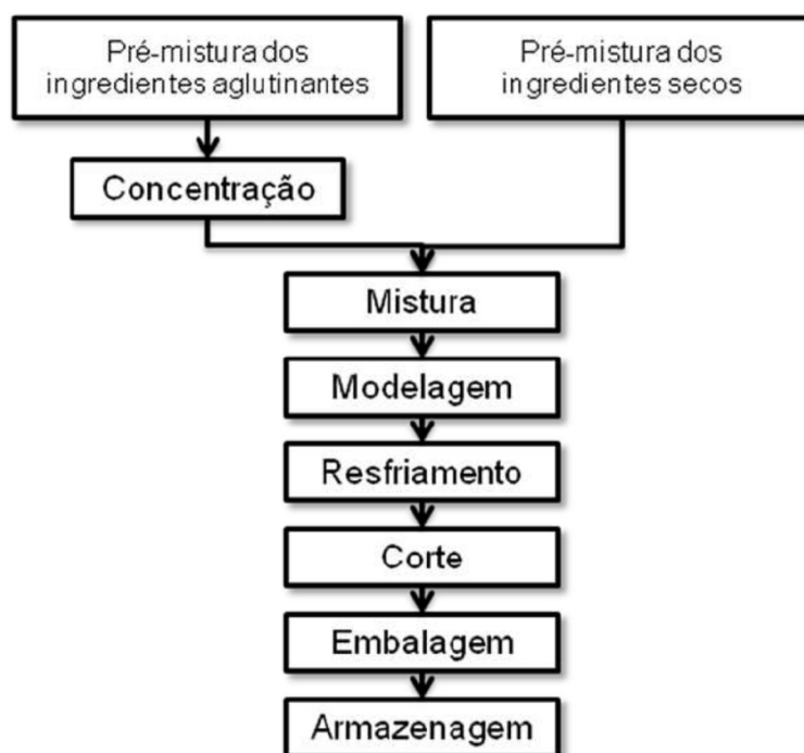
Figura 1 - Fluxograma do processamento das barras de cereais.

Primeiramente foram homogeneizados separadamente os ingredientes secos e os aglutinantes. Estes últimos foram concentrados em temperatura de aproximadamente 95°C por 2 min, em seguida foram adicionados os ingredientes secos. A modelagem das barras foi realizada utilizando um molde vazado de forma que o tamanho das barras fosse padronizado em 9x3x1,5 cm, e o resfriamento foi feito a \pm 20^{\circ}\text{C} por 10min. As barras de cereais assim obtidas foram acondicionadas em embalagem de alumínio e armazenadas em lugar seco e arejado e na temperatura ambiente.